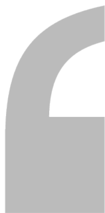
TABLE DES ACRONYMES